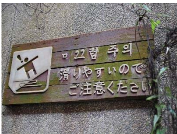
日本語表記の注意書きも